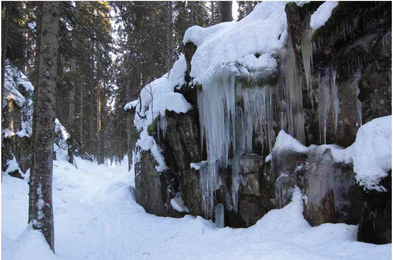
Fig. 2. Vinterstemning i den bortgjemte Svartdalen i Østmarka ved Oslo. Denne sprekkedalen er en del av Spinneren friluftslivsområde på 3,5 km 2 som ble vernet etter Markalovens § 11 den 4. oktober 2013.

februar. Vi hakket oss opp i nær 2,6 prosent med 76 km 2 vern, derav 48 km 2 produktivt. Julegaven var en stor pakke på 53 områder den 12. desember 2014, fordelt på 12 fylker. Hele 131 km 2 ble vernet, hvorav halvparten produktiv skog (70 km 2 ). Ni områder i Oslomarka ble vernet 20. mars 2015. Det innebar 14 km 2 mer Marka-vern, hovedsakelig produktiv skog (12 km 2 ). En rekordstor pakke på 66 områder i 13 fylker ble vernet på tampen av 2015 (12. desember). Med sistnevnte pakke på 260 km 2 (derav 162 km 2 produktivt) kunne klima- og miljøminister Tine Sundtoft melde at verneomfanget var nær 2,9 prosent. Hun hadde brukt de høye bevilgningene godt, og førte en lang rekke frivillige verneområder i havn. Like etterpå ble hun etter eget ønske skiftet ut med tidligere europaminister Vidar Helgesen. Han lovet i en rekke leserbrev å videreføre et ambisiøst skogvern. Likevel